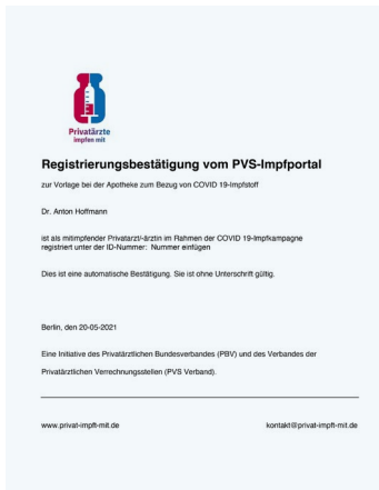
Muster der Registrierungsbescheinigung des PVS-Impfportals

Nach Prüfung der Daten durch die PVS-Verbands geschäftsstelle erfolgt eine Freischaltung für das Portal. Die Zugangsdaten werden per SMS und E-Mail zugesandt. Dieser Prozess kann bis zu drei Werktagen in Anspruch nehmen.